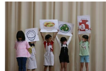
1年生にクイズを出す2年生

新1年生が入学して10日が過ぎ、8名の新1年生も少しずつ学校に慣れてきたようです。4月21日(金)には、天気が心配されましたが、1年生を迎える会と歓迎遠足を実施できました。各学年から1年生に学校のことを紹介する発表や集会委員会からは、学校のことを知ってもらおうと〇×クイズで1年生にも分かりやすいようにクイズの中身も考えてくれていました。ちょっとしたところに1年生への心遣いが感じられ、その中で生活することで、自然と思いやりの心も育てているのだと感心しました。お世話をしてくれた運営委員会のみなさん、ありがとう!