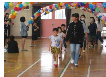
歓迎のアーチをくぐる1年生