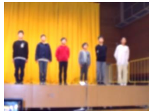
6年：発表「平和へのメッセージ」♡長崎に行って五感で感じたことを伝えようとする姿が、とても頼もしかったですね。

<感想> 保護者の皆様、地域の皆様からたくさんのお褒めの言葉をいただきました。 ・開始前の子どものための雰囲気からなると温かい小学校なんだ・・・と。そして、のびのびと発表する子どもたちの心は、人権はしっかり守られているのだなあと、先生方、地域の方に感謝したいです。子どもたちの一生懸命な姿に感激しました。 ・練習の時から皆ですとがんばっていたことがよく分かる発表でした。身体、全身を使って表現しており、心に響いてきました。ありがとうございました。