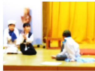
3年：劇・発表「三年とうげ、韓国の文化発表」 ♡役になりきっての演技すばらしかったですね。見方を変える大事さを学びました。