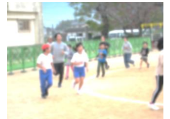
持久走タイムに練習に励む子どもたち