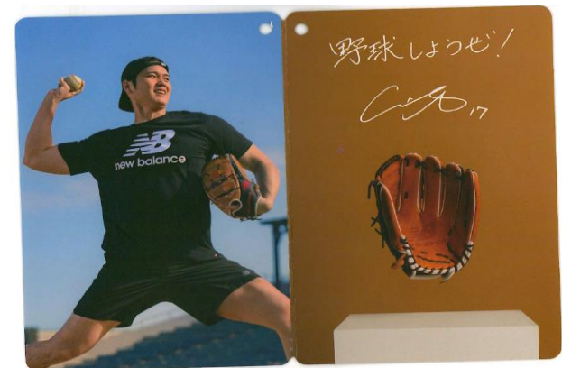
【大谷翔平選手からのメッセージ】