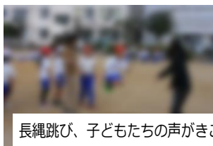
長縄跳び、子どもたちの声がかきこえてきそうです。