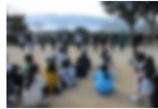
4年生の地震での避難について発表