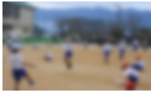
個人跳びにいどむ子どもたち