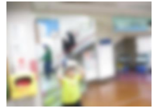
頭を守って避難しています

改めて教育の場で、「正しく知ること」や「一人ひとり違いがあり、認め合っていくこと」を、小さいときからくり返し学習していくことの大事さを感じました。